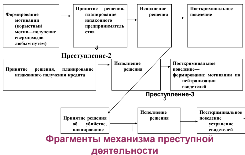
Рис.2. Фрагменты механизма преступной деятельности.

Проиллюстрировать предложенную схему можно следующим примером. Сформировалась мотивация жить не хуже высокообеспеченных граждан и добиться высокого материального уровня. Затем человек может принять одно из следующих решений: избрать законный путь достижения благополучия (окончить юридический факультет, изучить иностранные языки и поступить на высокооплачиваемую работу) либо – при осознании недоступности для него легального пути - встать на преступный путь обогащения (кража, вымогательство и т. п.). Однако это решение может быть не реализовано, например, в результате надежной охраны объекта планируемого посягательства. Или реализовано иначе: на этапе исполнения решения грабеж или кража при сопротивлении жертвы или иных лиц может перестать в разбой, причинение телесных повреждений и т.д.